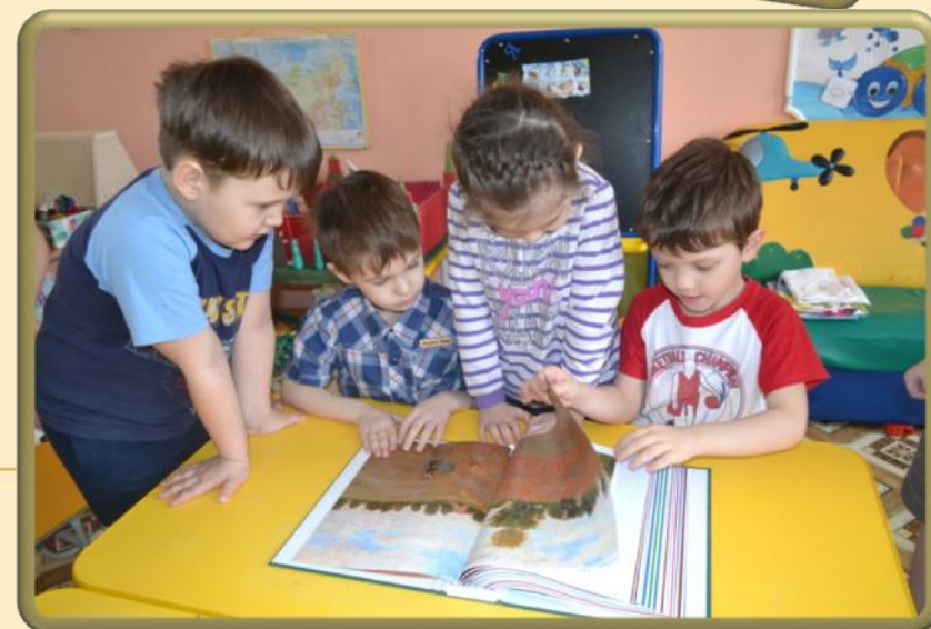
Рассматривание картин и иллюстраций