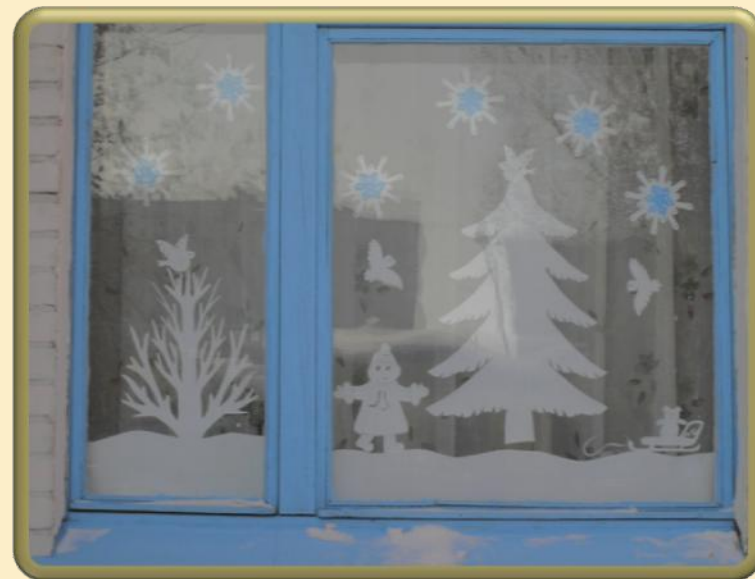
Оформление в соответствии с названием группы