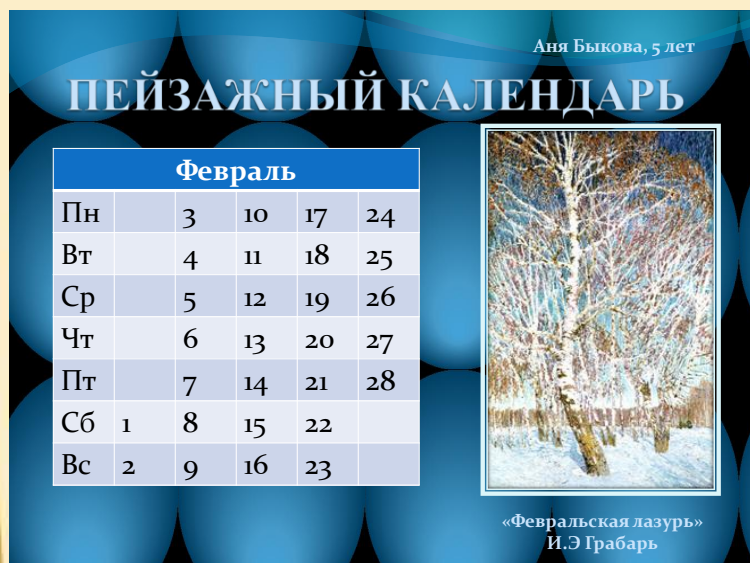
Лист календаря за февраль месяц, совместная работа детей и родителей

Впечатления детей о красоте природы в рисунках