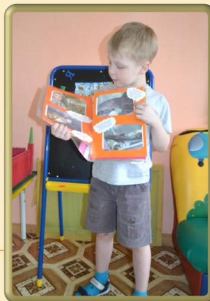
Детские мини- презентации