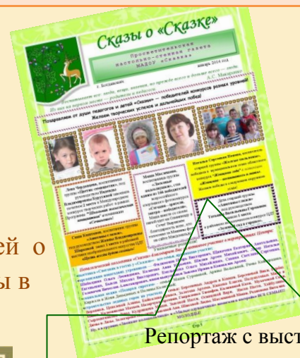
Репортаж с выставки в газете «Сказы о сказке»