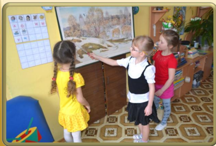
Рассматривание картин и иллюстраций