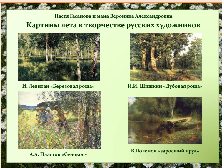
Страница альбома-галереи «Времена года»