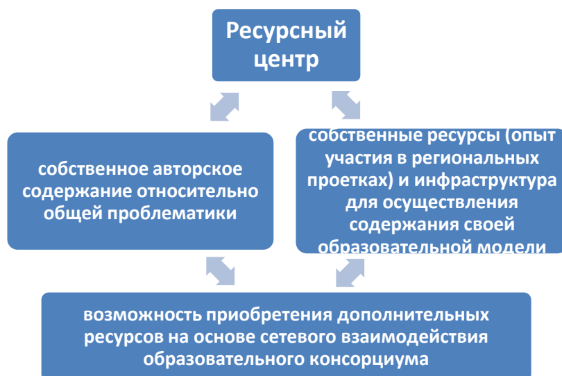
Рис. 1 Обоснования признания ДОО территориальным Ресурсным центром оценки качества дошкольного образования.

Потребность в создании территориального Ресурсного центра объясняется отсутствием информационно-методического отдела в системе Управления образования ГО Богданович, что исключает возможность создания своеобразной платформы для реализации инновационных практик в работу ДОО.