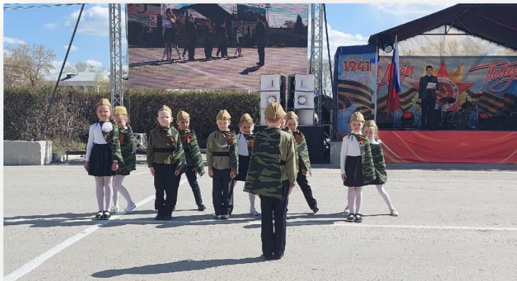
Городской патриотический конкурс «Солдатская звездочка»

Муниципальный фестиваль «Победа глазами детей»