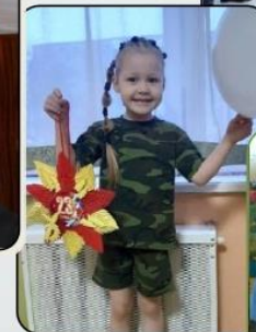
Конкурсы и проекты