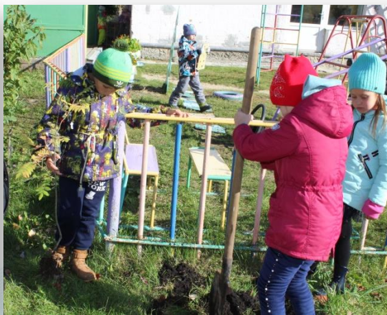
Весенняя неделя добра Поздравление сотрудников