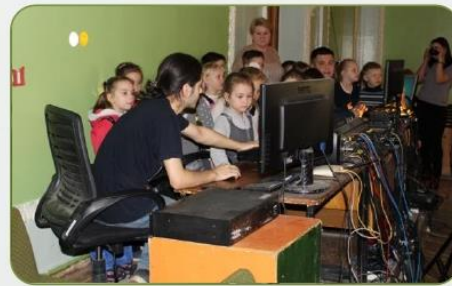
«Школа будущей профессии»