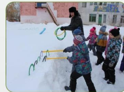
Военно-спортивная игра «Зарница»