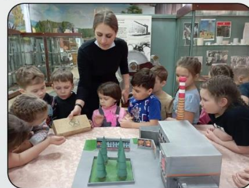
Музей ОАО «Огнеупоры»