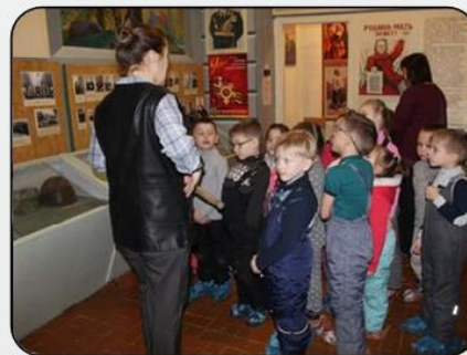
В музее боевой и трудовой славы