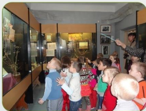
Городской краеведческий музей