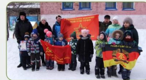
Взаимодействие с патриотическими клубами