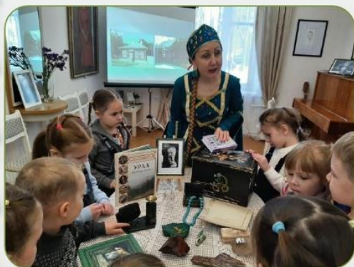
Музей им. С. Щипачева

МАДОУ «Сказка» осуществляет тесную связь с социальными партнерами в процессе обучения детей истории, традициям, культуре родного края