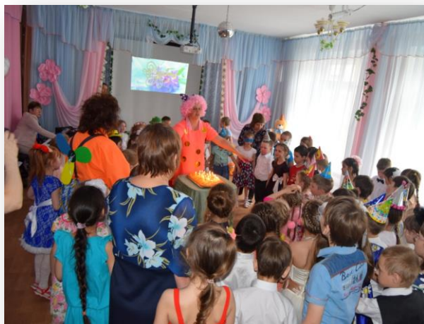
День рождения «Сказки» «Сказочная семья года»